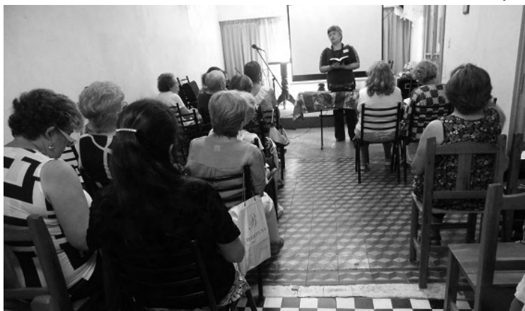
Ministerio de la Mujer

Finalizamos la misma alabando a nuestro Señor, celebrando su victoria en la cruz.