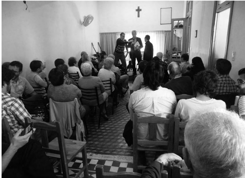
Reunión de Presbiterio