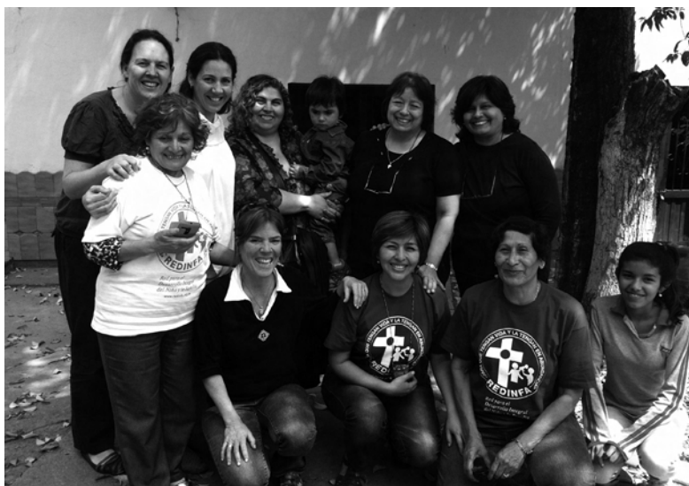
Participantes de REDINFA

En colaboración con el Casco Histórico de la Ciudad de Buenos Aires tenemos el objetivo de concientizar, sensibilizar y difundir la importancia del patrimonio, in-