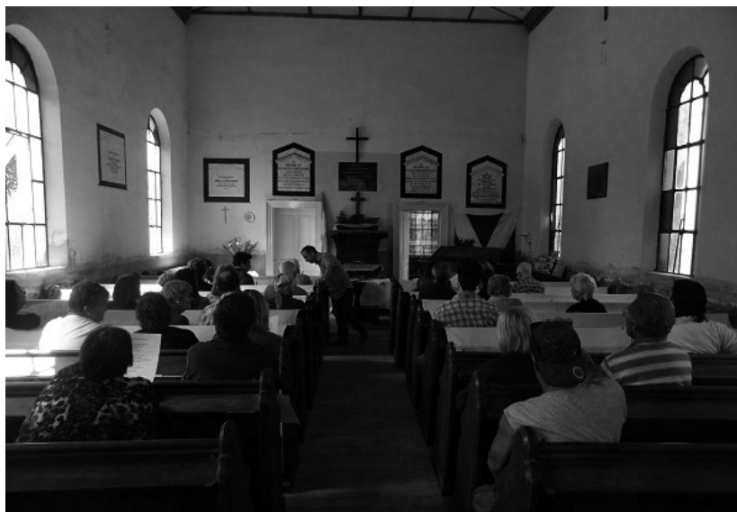
Dentro del templo de Chascomús