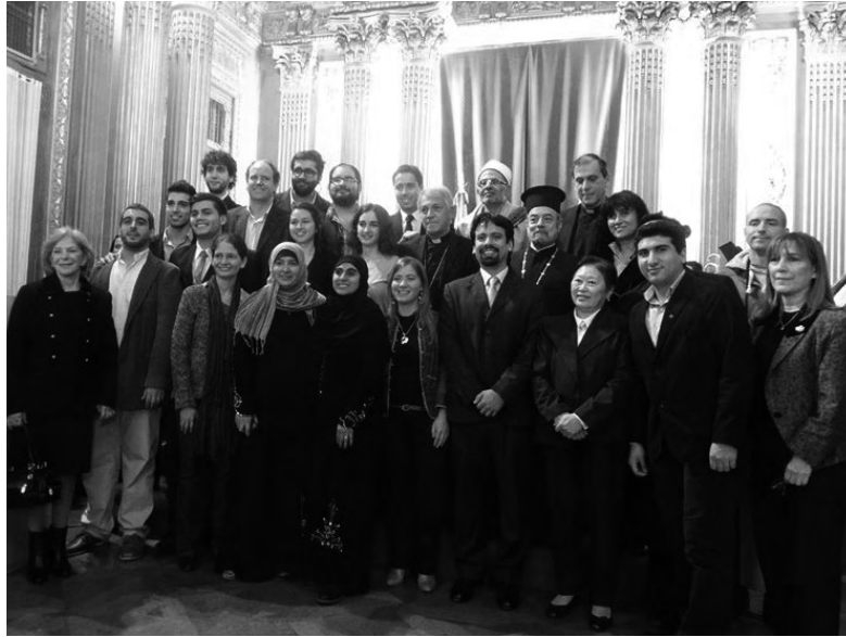
Los jóvenes de la RIJBA

Interreligiosa de Jóvenes de la Ciudad de Buenos Aires (RIJBA), el Espacio Cultural San Andrés sigue participando activamente de la organización y las actividades que surgen en la mesa de diálogo interreligioso, en contacto con el Gobierno de la Ciudad de Buenos Aires y distintas instituciones religiosas.