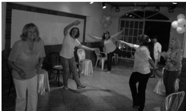
El patio de Mabelita

Es una oportunidad para distendernos en un hermoso ambiente y salir renovadas en nuestro cuerpo, alma y espíritu. Ya se vienen realizando encuentros en este lugar desde el año pasado, y cada día hay una sorpresa agradable que el Señor nos tiene preparada.